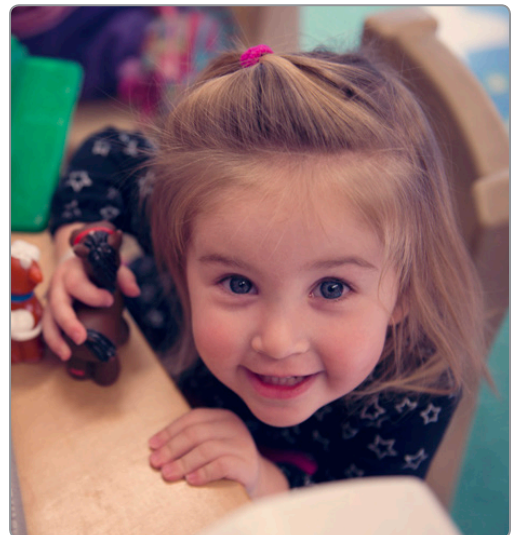
Les amis de la garderie La Boîte à soleil à l'École LaMarsh de Niagara Falls - un des sept centres de la coopérative.

Ces écoles de langue française accueilleront les élèves de la maternelle à la 6 e année et ceux de la 7 e à la 12 e année de partout dans la péninsule de Niagara.