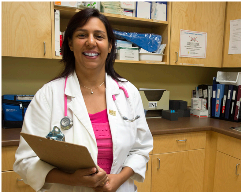
À Welland, la clinique médicale, Centre de santé communautaire Hamilton/Niagara offre des soins de santé primaire en français.

Nous reconnaissons le droit des francophones d'être servis en français et travaillons avec nos partenaires afin de les offrir.